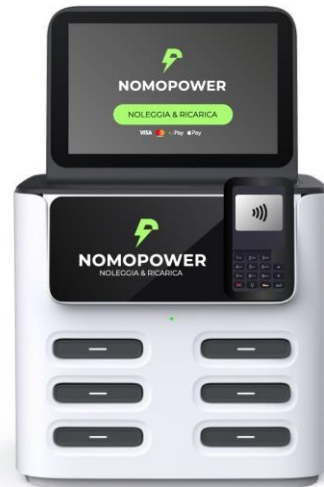
Nomopower 6 slot