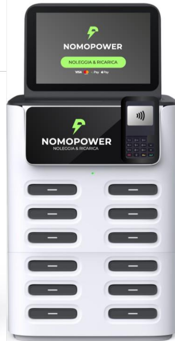
Nomopower 12 slot